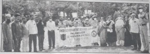
ర్యాల్లో పాల్గొన్న ఎన్సీసీ క్యాడెట్లు, అధికారులు